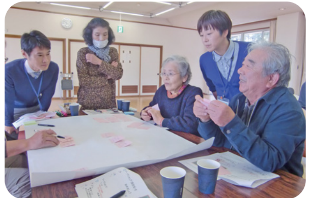
地域の困りごと調査（中村）