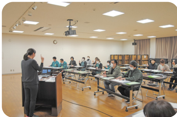
サンテラス(株) でのあいサポーター研修