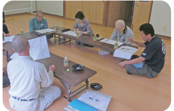
那久路 生活支え合い委員会