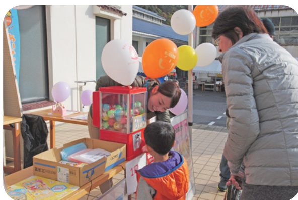
共同募金運動（いきいき祭り）