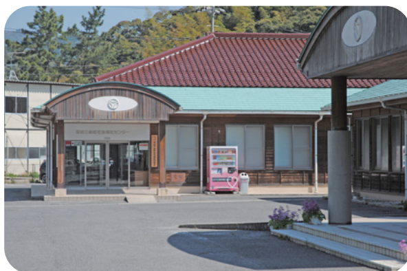
隠岐の島町社会福祉センター