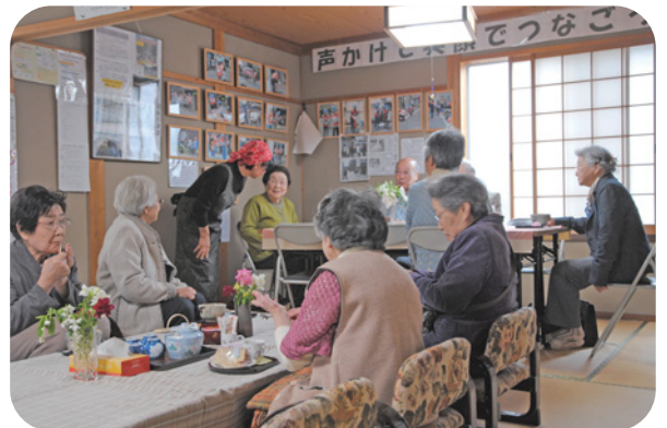
サロン活動（目貫きサロン・縁：中町）