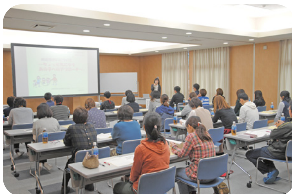
福祉人材育成研修