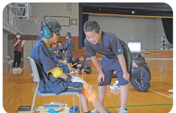
西郷中学校での福祉学習