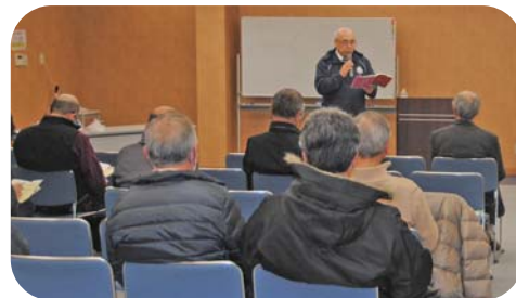
災害ボランティア講演会