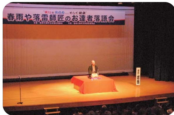
お達者落語口演会