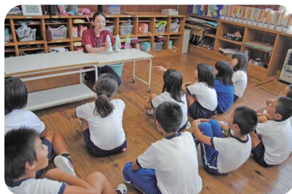
五箇小学校の福祉学習