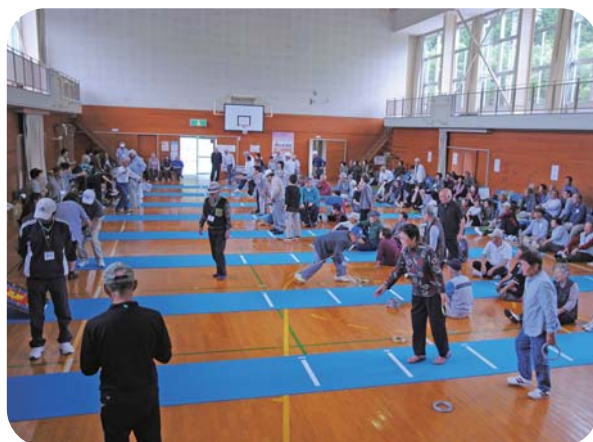
クロリティー親善交流大会 (老人クラブ)