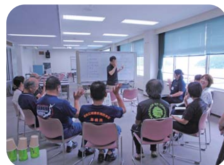
あいサポートメッセージャー研修