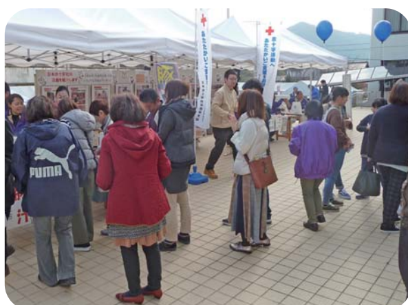
いきいき祭での広報活動 (日本赤十字社)