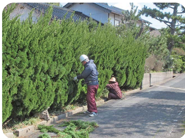
シルバー人材センターの活動