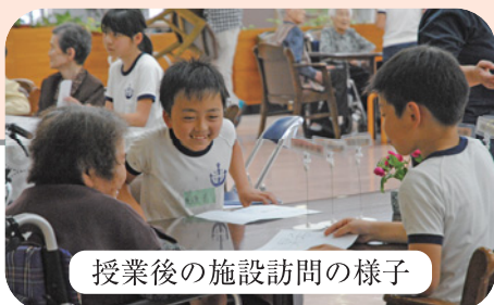
授業後の施設訪問の様子

「うわああ!?!」や「わい」という声かろうか中に響きます。「目の不自由な人って、こんなに苦労して、トイレに行ったり、ジュースを飲んだりしてるんだ」と、今日このとき初めて分かりました。また、行く方向や案内をする人の体験をしたときは、「こっちこっちでついて来る人の安全を確かめながら歩くのはむずかしい事だな」と思いました。私は、ユニバーサルグッズにもびっくりしました。体などが不自由な人だけじゃなく、私達まで使いやすい仕組みがたくさんありました。「ふだんのくらしのしあわせ」というものを改めて感じました。特に優しいなと思ったグッズは「トイレ」です。子どもやおじいさん・おばあさん、赤ちゃんのいるお母さんなど、色々な人々に使いやすい工夫がされていて全ての人使いやすいと思いました。 手話では、思ったことが2つあります。1つ目は、手話を言葉だと思、たことです。手話を教えていただいたときに「口もは、きり開けて」と言われました。耳の不自由な人は、手話で「口」を見る事を知りました。もし、困、ている人を見つけたら、 どうい と手話を使、てみようと思いました。 今日、私は♡あいさポーター♡に認定されました。こんな役に認定されたからには、声をかけたり、助けたりする勇氣、を持、て行動したいと考えました。そして、体の不自由なことを特別にしたりせず、1人の人として接したいと思、います。