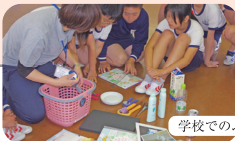
学校でのふくしの授業の様子