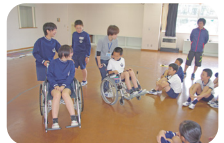
西郷小学校での福祉学習