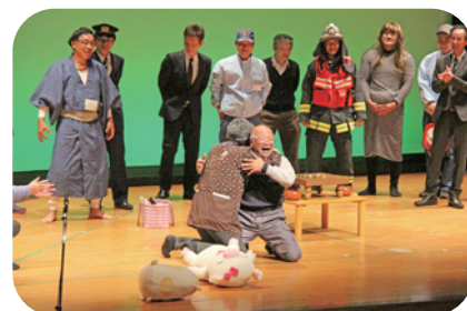
隠岐素人余芸大会