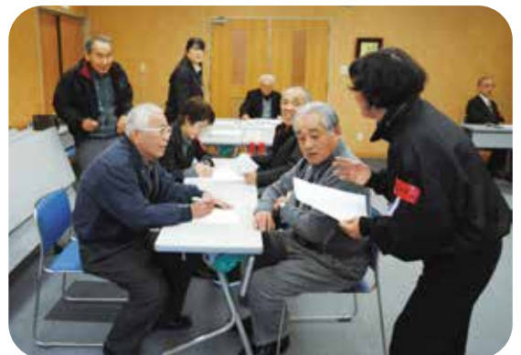
災害ボランティアセンター設置運営訓練