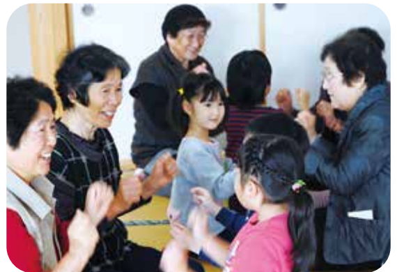
ふれあい・いきいきサロン活動 犬来ふれあいサロンともだち