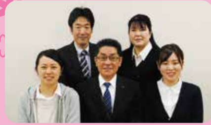
▲あんしんセンタースタッフ

近年、隠岐の島町においても、さまざまな事情から金銭面でお困りの方、隣近所との関わりがなく孤立している方、引きこもっている方、いくつもの問題が重なり悩みを抱えている世帯など、容易には解決できない状況で生活している方が増えています。