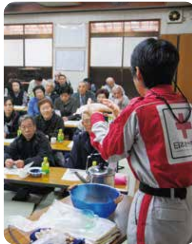
赤十字防災啓発講習