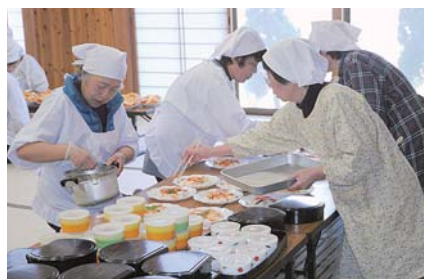
今津地区高齢者への配食活動 (ふれあいサロン白鳥)