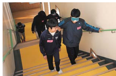
都万中学校での福祉学習