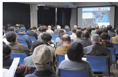
住みよい地域づくり推進フォーラム