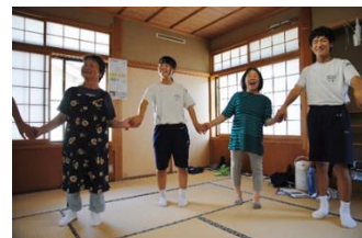
高齢者サロンでの交流