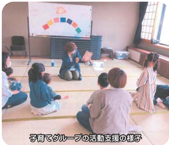
子育てグループの活動支援の様子