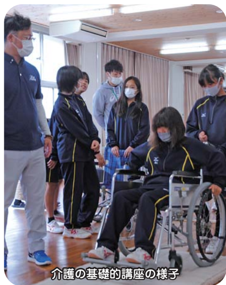
介護の基礎的講座の様子