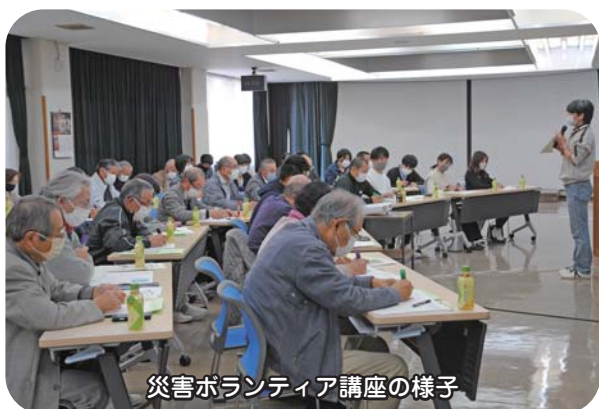
災害ボランティア講座の様子