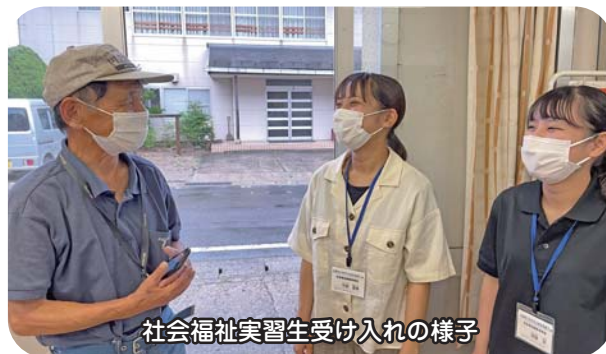
社会福祉実習生受け入れの様子