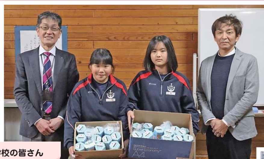
西郷小学校の皆さん

赤い羽根共同募金運動では、戸別募金・学校募金・募金箱の設置などの活動を行いました。隠岐の島町でいただいた募金は、主に隠岐の島町の地域福祉活動に活用され、その他、島根県内の福祉施設などへの活動助成や災害時の被災地支援のために役立てられます。