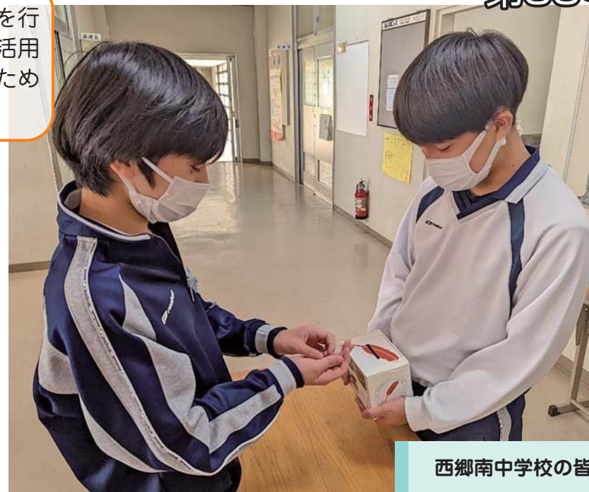
西郷南中学校の皆さん