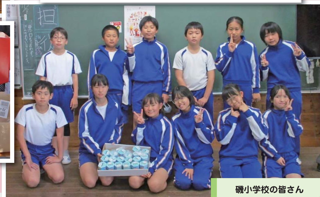
磯小学校の皆さん