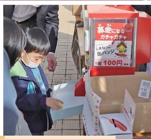
いきいき祭りでの募金活動