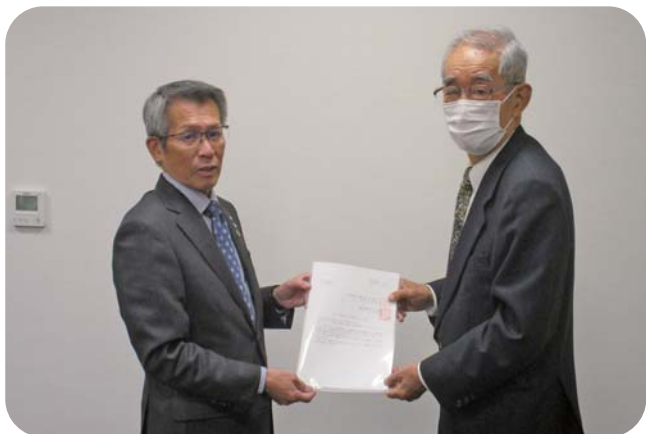
(左) 池田町長 (右) 出川会長

懇談会では、老人クラブの現状や運営について情報を共有し、感染症や物価の高騰により変化した高齢者の生活などについて意見を交わしました。