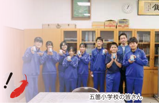
五箇小学校の皆さん

この寄付金は、隠岐の島町の地域福祉の増進のため、また島根県内の災害時の支援、社会福祉団体の活動、地域福祉事業に有効に活用させていただきたいと存じます。