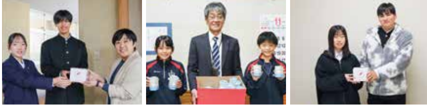
隠岐高校の皆さん

この寄付金は、隠岐の島町の地域福祉の増進のため、また島根県内の災害時の支援、社会福祉団体の活動、地域福祉事業に有効に活用させていただきたいと存じます。