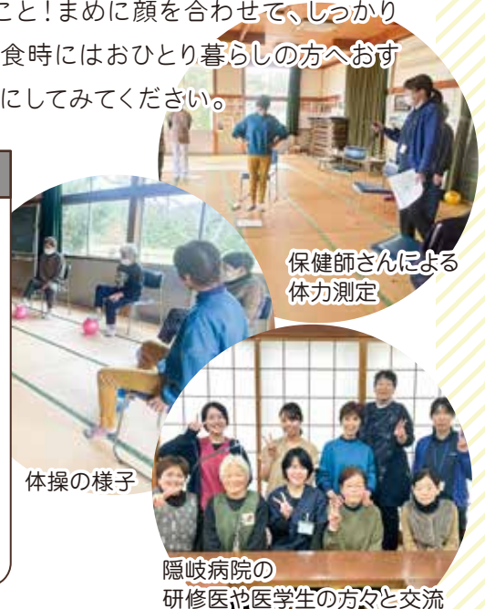
保健師さんによる 体力測定

開催日は、毎週月曜日と木曜日の週2回!これだけの頻度で集っているふれあいサロンはなかなかありません!また、四季折々の行事を大切にしながら、誘い合って町内の行事に参加したり、バスハイクへ出かけたり…参加者で楽しみながら活動しています!