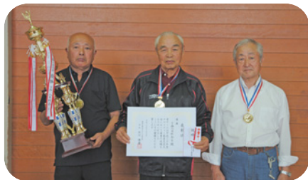
◎団体戦 優勝 下西八百杉会B (磯)