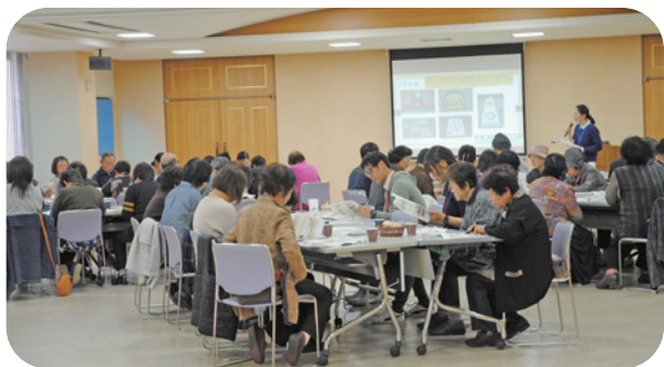
▲活動メニューの紹介