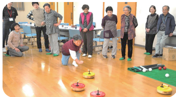
▲レクリエーション体験