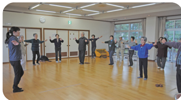
▲「隠岐の風体操」の紹介

社会福祉協議会では、「自分たちも集まってみたいけど、良い方法はない?」、「サロンについて詳しく知りたい」などのご相談をお受けしています。また、レクリエーション用具の貸出も行っていますので、是非ご利用ください。