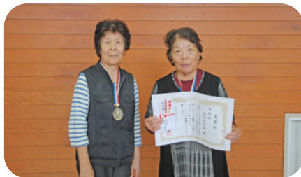
準優勝 ほほえみ会 (布施) 第三位・武良松寿会A (中村) ・寿会 (布施)