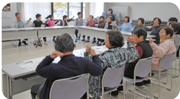
▲座ってできるゲーム体験