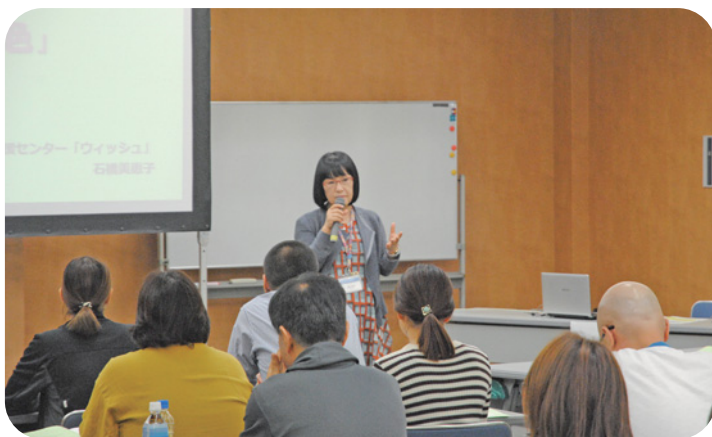
福祉人材育成の研修会