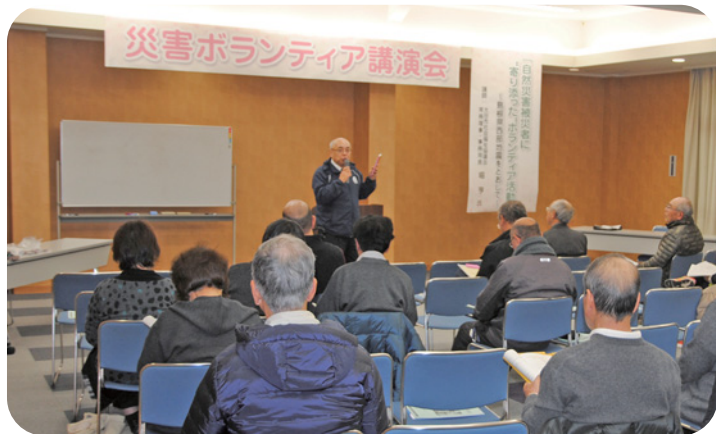
災害ボランティアセンター運営者及び運営支援者の養成