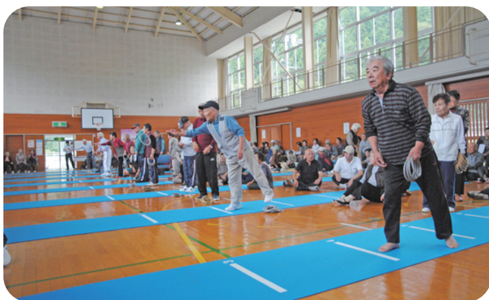
隠岐の島町老人クラブ連合会 クロリティー大会