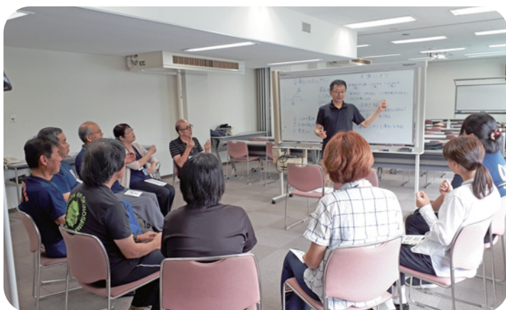
あいサポートメッセンジャー研修