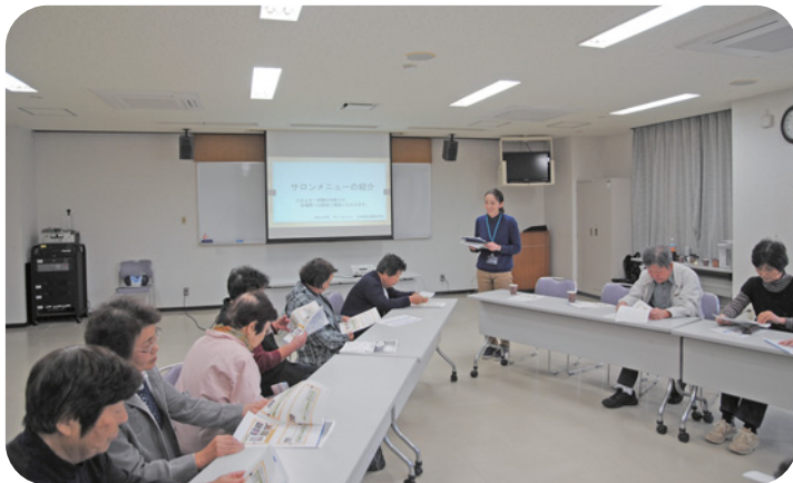
サロン活動推進事業 サロンのつどい