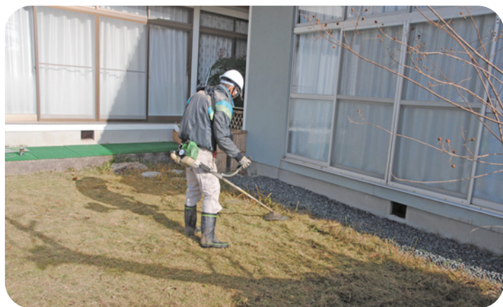
シルバー人材センター事業 活動状況