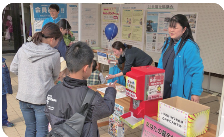
隠岐の島町いきいき祭りでの広報啓発