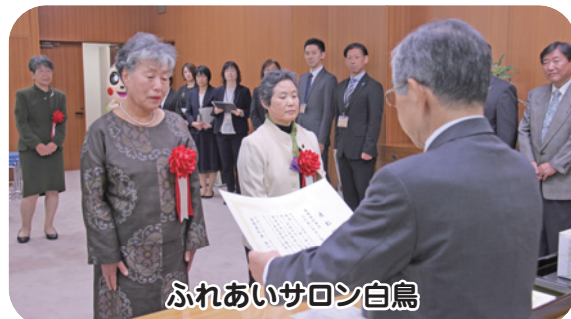
ふれあいサロン白鳥

今津地区で28年間、高齢者を対象とした会食と配食を行い、閉じこもり予防と見守りにつながる活動を長年続けてこられました。今ではボランティアスタッフの生きがいや喜びにもなっています。