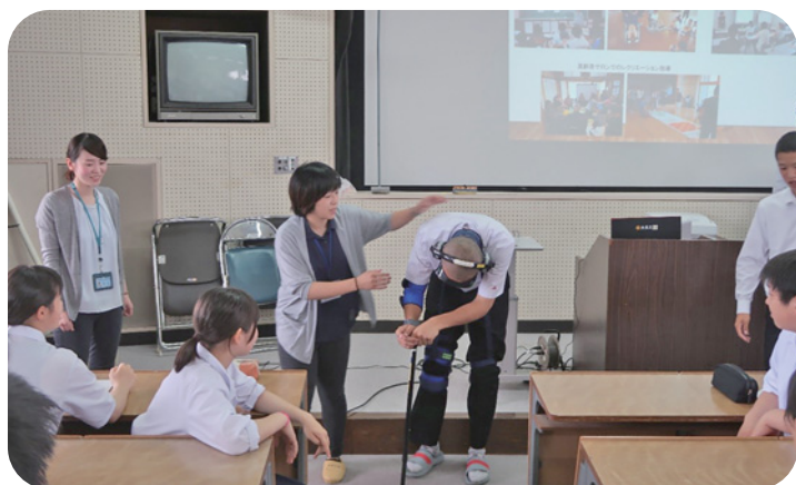
福祉教育推進事業 高齢者疑似体験の様子