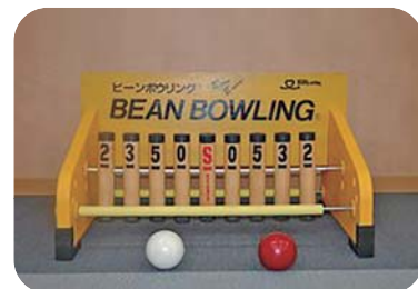
ビーンボーリング