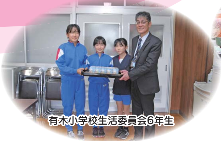
有木小学校生活委員会6年生