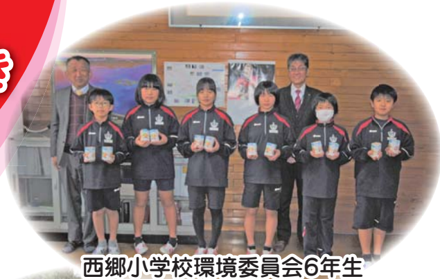
西郷小学校環境委員会6年生