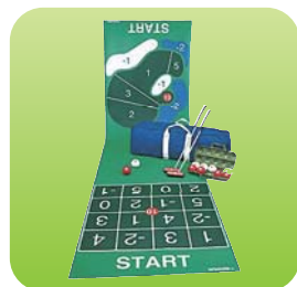
シャッフルゴルフ