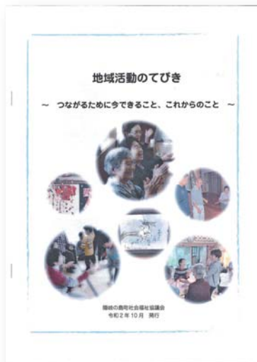
地域活動のてびき

本会では職員派遣やレク用具の貸出などで地域活動を支援しています。また、コロナ禍でもつながり続けるためにはどうしたらよいかという視点から、活動の参考になればと「地域活動のてびき」を作成しました。ご覧になりたい方は本会までご連絡いただくか、ホームページをご覧ください。