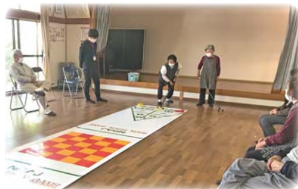
職員派遣・レクリエーション実践の様子