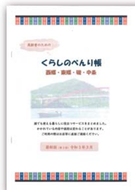
▲くらしのべんり帳

くらしのべんり帳が必要な方は社会福祉協議会のホームページからダウンロードしていただくか、地域福祉係（2-0685）までご連絡ください。