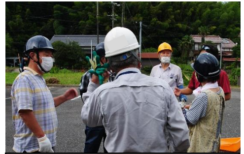
みんなで活動の振り返り中です。

※毎月第3金曜日に入会説明会を開催しています。説明会への参加もお待ちしています。