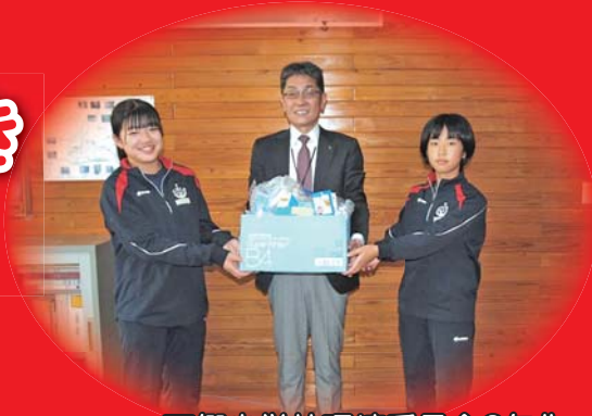
西郷小学校環境委員会6年生