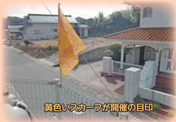
黄色いスカーフが開催の目印