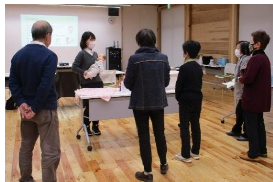
▲1月開催の事業説明会の様子

研修については、会員向けには希望者があれば、実施いたします。内容としては「おむつ交換・沐浴の手伝い等の技術面の不安を解消できるもの」と考えております。