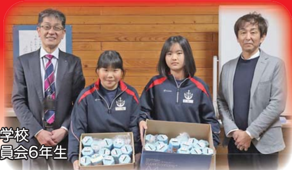
西郷小学校 環境委員会6年生