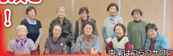
中条はつらつサロン