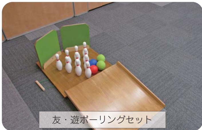
友・遊ボーリングセット

地域活動、学校行事、施設でのレクリエーションなどに活用できる用具の貸し出しを行っています。以下の用具の他、利用可能なものについてはホームページをご覧ください。か、お電話（2-0685）にてお問い合わせください。