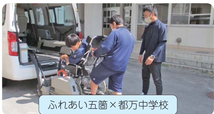
ふれあい五箇×都万中学校

施設で行っている福祉サービスやご利用様が最期を幸せに過ごせるようお手伝いする大切な仕事であることを教えて頂きました。その後、飲み込みやすいよう工夫されたとろみ食を使つての食事介助、車いすを体験しました。