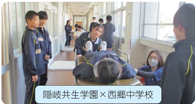
隠岐共生学園×西郷中学校

高齢者の身体の特徴などについて詳しくお話があり、その後、車いす、ストレッチャーの使い方や食事介助についても教えて頂きました。また、ご本人の希望を叶えるための計画作成を体験しました。