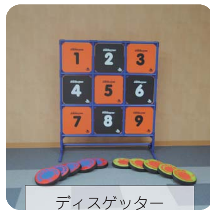
ディスクゲッター