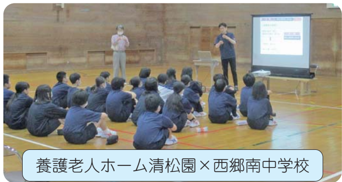
養護老人ホーム清松園×西郷南中学校

高齢者の身体の特徴などについて詳しくお話があり、その後、車いす、ストレッチャーの使い方や食事介助についても教えて頂きました。また、ご本人の希望を叶えるための計画作成を体験しました。