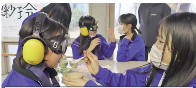
特別養護老人ホームなごみ苑×五箇中学校

高齢者の身体の特徴や利用者様との関わりを通じて感じる仕事のやりがいについてお話があり、その後、高齢者体験と介助における声かけの大切さを教えて頂きました。