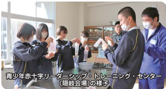
青少年赤十字リーダーシップ・トレーニング・センター(隠岐会場)の様子