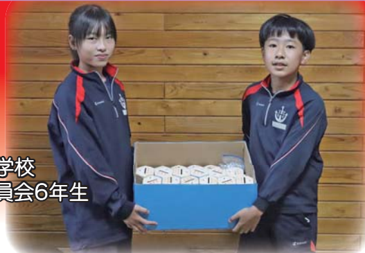
西郷小学校 環境委員会6年生