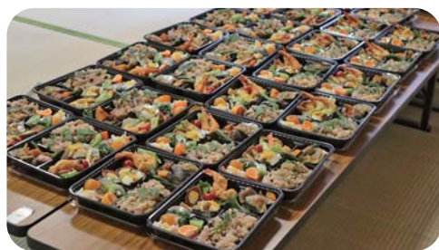
▲毎回地元食材を使った季節が感じられるお弁当をお届けしています